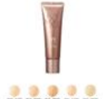
③ファンデーション 色:いずれか1色